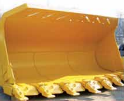
Caçamba para carregadeira com sistema de GETs Loadmaster II

A ESCO Corp. é referência mundial no desenvolvimento de tecnologias contra desgaste. Com os recentes lançamentos no Brasil do ESCO Supply & Service, nova unidade ESCO Corp. no Pará, do ESCO Supply & Service Mobile, conceito inovador de serviço de campo, e do sistema de dentes antimarreta Ultralok, as soluções da empresa estão ainda mais completas. Mais do que o compromisso da ESCO Corp. de oferecer produtos e serviços de incomparável qualidade, a expansão de sua capacidade é reflexo de uma atuação arrojada, na qual a disponibilidade e a parceria com o cliente estão em primeiro lugar.