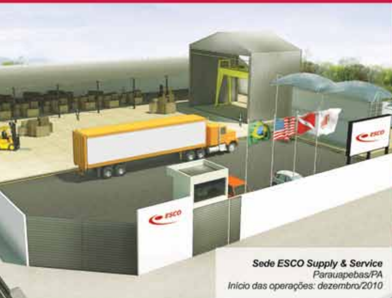
Sede ESCO Supply & Service Paraupabas/PA Início das operações: dezembro/2010