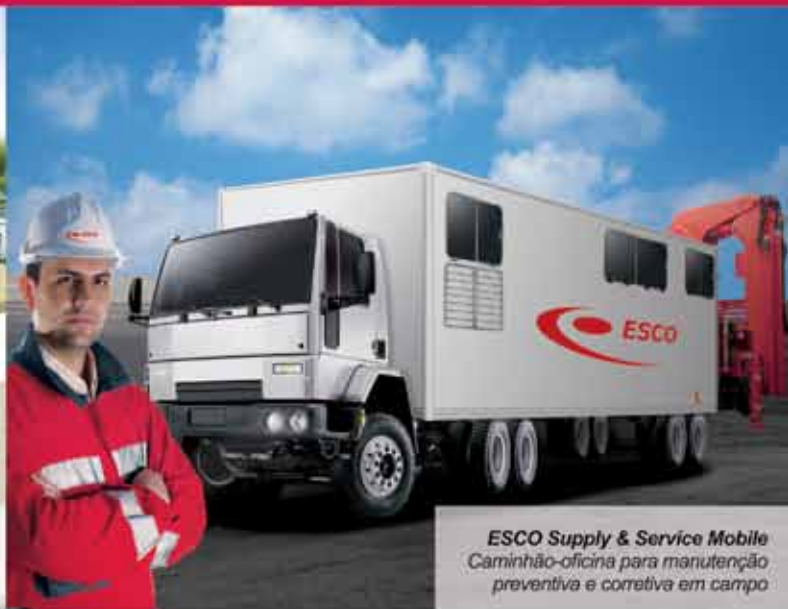
ESCO Supply & Service Mobile Caminhão-oficina para manutenção preventiva e corretiva em campo

A ESCO Corp. é referência mundial no desenvolvimento de tecnologias contra desgaste. Com os recentes lançamentos no Brasil do ESCO Supply & Service, nova unidade ESCO Corp. no Pará, do ESCO Supply & Service Mobile, conceito inovador de serviço de campo, e do sistema de dentes antimarreta Ultralok, as soluções da empresa estão ainda mais completas. Mais do que o compromisso da ESCO Corp. de oferecer produtos e serviços de incomparável qualidade, a expansão de sua capacidade é reflexo de uma atuação arrojada, na qual a disponibilidade e a parceria com o cliente estão em primeiro lugar.