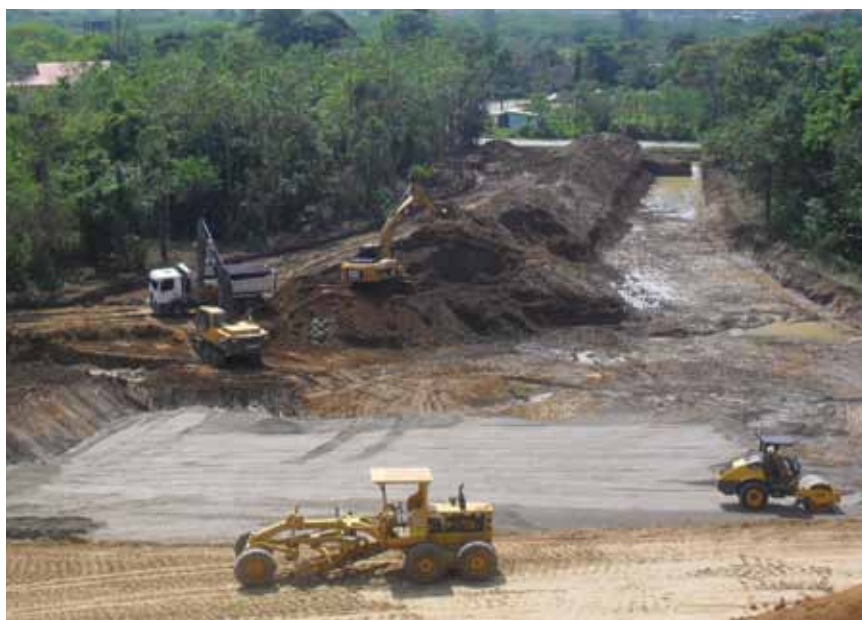
Demanda está sendo impulsionada por obras de grande porte

O parque de máquinas da linha amarela com vida útil de até 10 anos saltou de 122 mil unidades, em 2009, para 146 mil unidades, no ano passado, devendo chegar a 198 mil equipamentos, em 2012, e 270 mil unidade, em 2014. "Esses níveis de frota não têm paralelo em nossa história e talvez