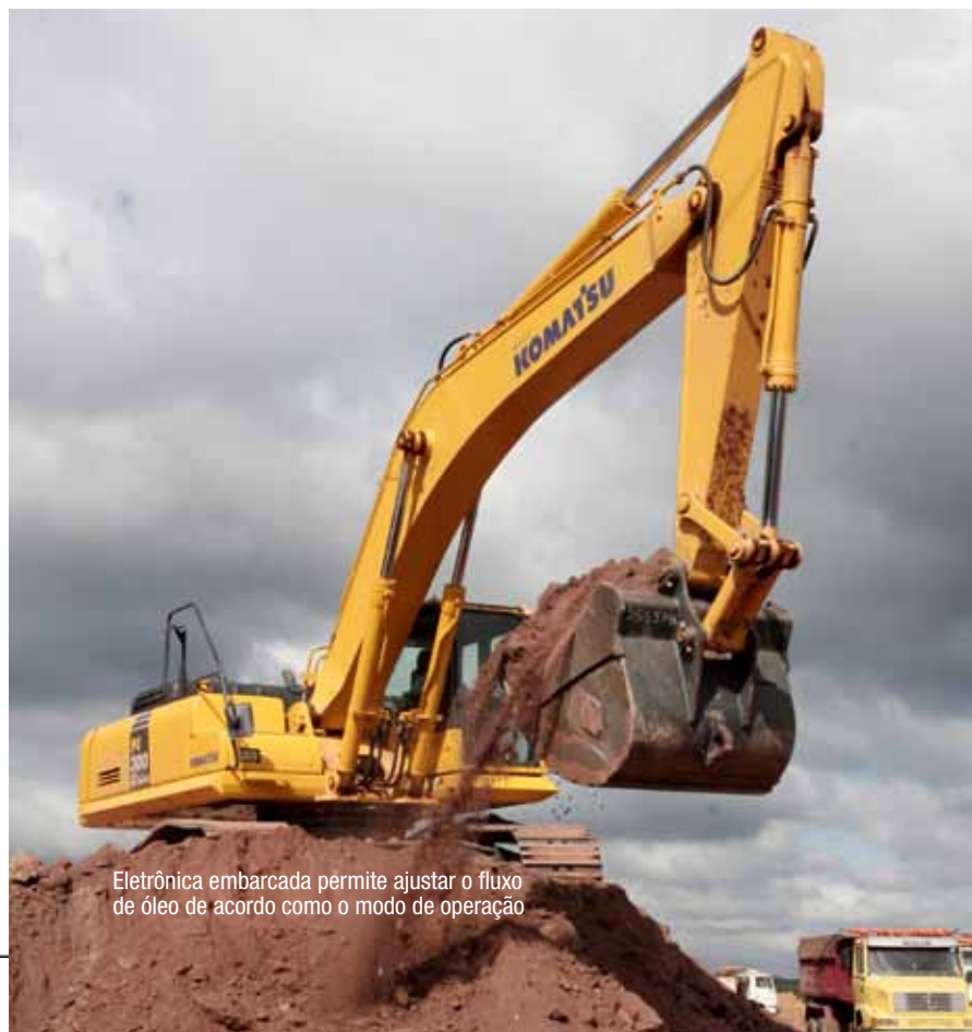
Eletrônica embarcada permite ajustar o fluxo de óleo de acordo como o modo de operação

“O conjunto hidráulico servo e o principal compõem a tecnologia hidráulica convencional das escavadeiras. As inovações, todavia, estão na substituição dos acionamentos hidráulicos pelos eletrônicos nos sistemas servo”, diz ele. Presente nos equipamentos de todos os fabricantes de escavadeiras de primeira linha, a eletrônica embarcada tem a função de diminuir a quantidade de acionamentos hidráulicos no equipamento. As vantagens dessa solução são diversas, com destaque para a redução de vazamentos, o melhor controle operacional e até mesmo a redução de custos com peças, já que a função eletrônica custa muito menos do que