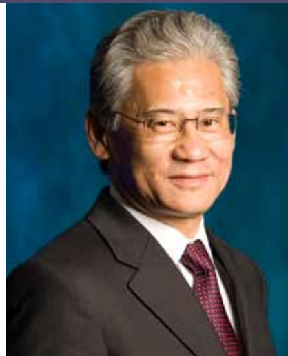
Yoshio: mercado interno superou exportações

Para se firmar entre os três principais fabricantes de equipamentos para construção do mercado, a Volvo CE deverá acirrar sua disputa com outros players solidamente estabelecidos no país: a Ca-