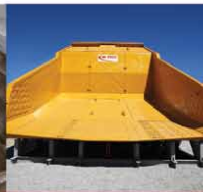
Báscula para caminhão fora de estrada

A mais completa linha de produtos e serviços contra desgaste, com padrão mundial de qualidade.