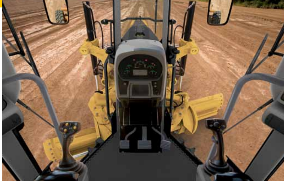
Melhor visibilidade: joysticks simplificam a operação