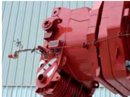
Anemômetro: presente na ponta da lança

identificado e obter auxílio para realizar manutenções mais simples em campo.