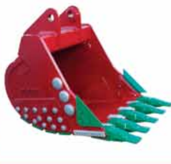
Caçamba para carregadeira padrão rocha