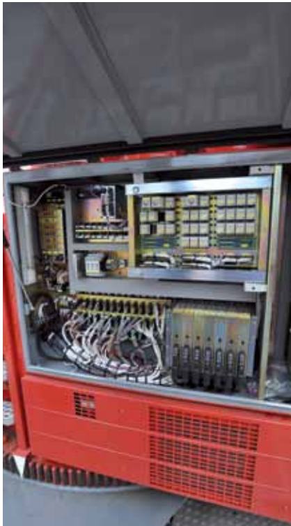
Central eletrônica: concentra todas as peças