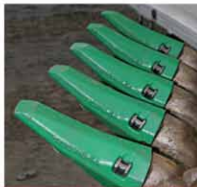
Sistema de dentes Ultralok