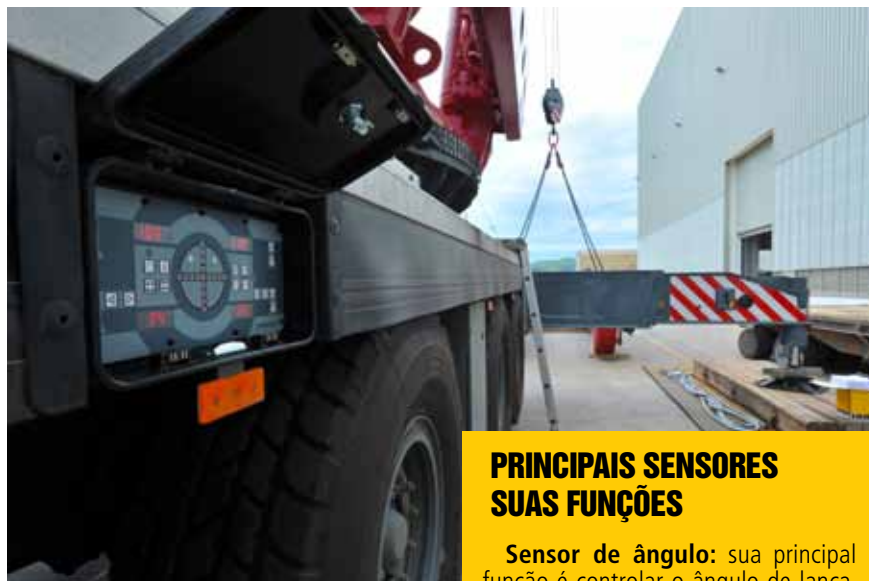
Painel monitora o nivelamento do guindaste

Procedimentos como a calibração ou ajuste dos sensores diretamente relacionados ao monitoramento de carga exemplificam a importância da especialização na manutenção. Em geral, os equipamentos contam com três tipos de sensores para o controle de elevação de cargas: o de ângulo, o de comprimento e o de carga. Os parâmetros deles são cruzados na central eletrônica do guindaste, onde é feito o cálculo das condições de trabalho para o içamento. Caso um desses sensores não esteja instalado corre-