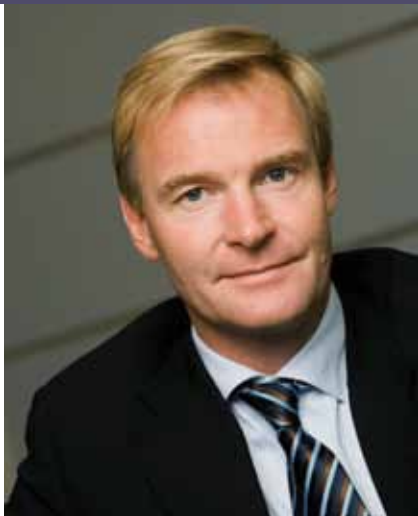
Persson: Brasil é mercado atrativo

ciência no consumo de combustível e a excelência no suporte em serviços de peças e assistência técnica.” Segundo ele, a estratégia da empresa se baseia em consolidar a presença local nos mercados importantes para seu negócio, mantendo a flexibilidade necessária para atendimento à demanda dos clientes.